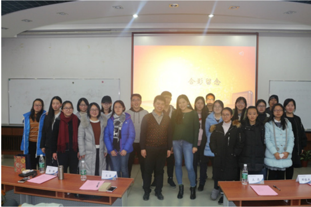
工商 1704 班与校友成长导师合影