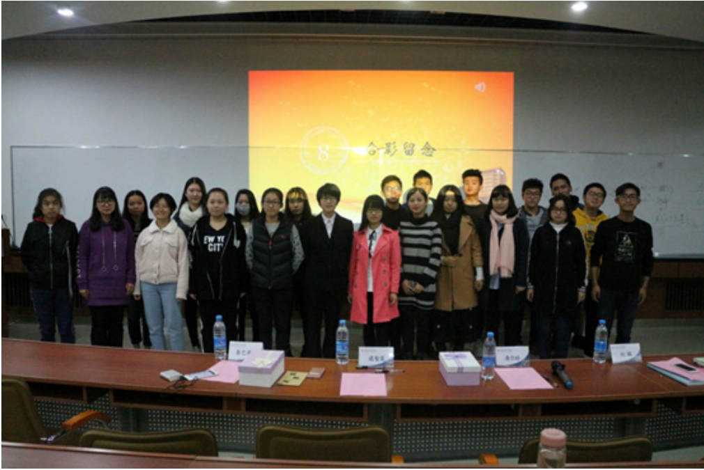
管理 1704 班与校友成长导师合影