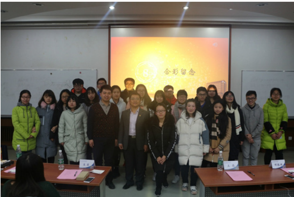
工商 1701 班与校友成长导师合影