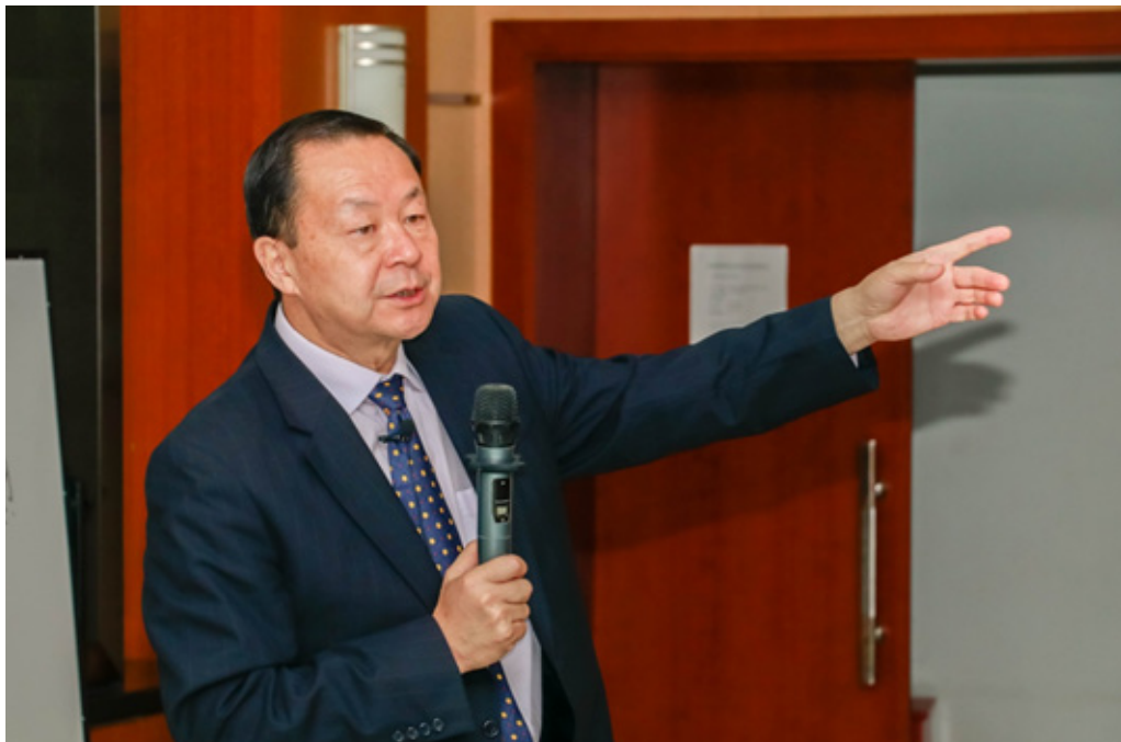
美国纽约市立大学巴鲁克学院兹科林商学院副院长胡清教授

2017年10月30日，美国纽约市立大学巴鲁克学院兹科林商学院副院长胡清教授来访我院，为我院师生进行了题为“NeuroIS: The Next Frontier of Information Systems Research”的学术报告。胡清院长生动地阐述了人的神经系统发育、认知形态与消费行为的关系，新颖的主题和精彩的演讲吸引了所有师生，全场座无虚席。