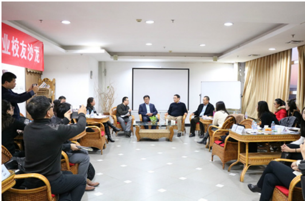
嘉宾与校友们面对面交流

主题分享过后，三位嘉宾与校友们进行了 30 分钟的面对面问答交流。在座的校友们踊跃提问，与嘉宾就企业使命与个人理想的冲突与融合、激活人才的方式、企业文化战略落地、企业运营体系的重要性、职业生涯的关键点等问题展开了探讨。