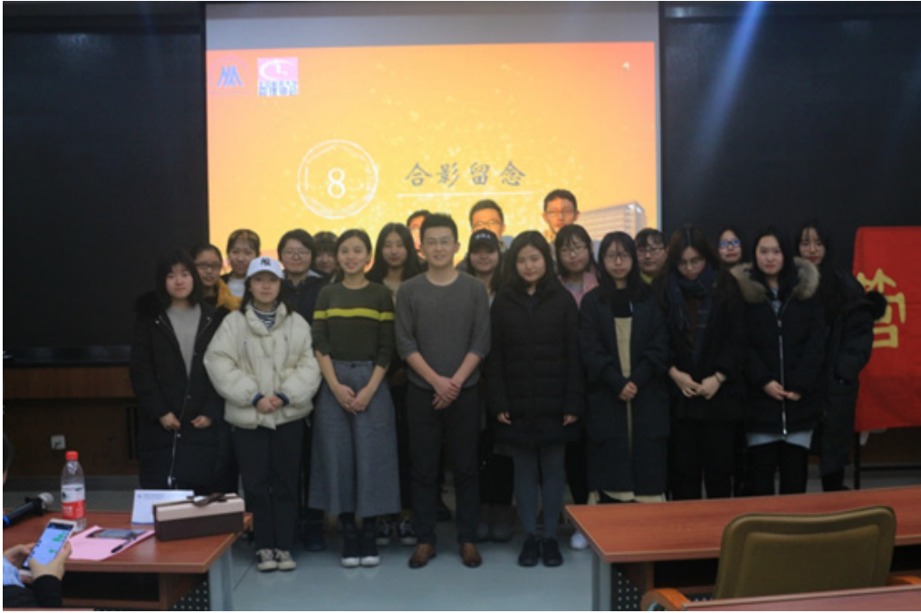
经济 1703 班与校友成长导师合影