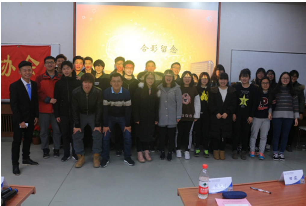
管理 1702 班与校友成长导师合影