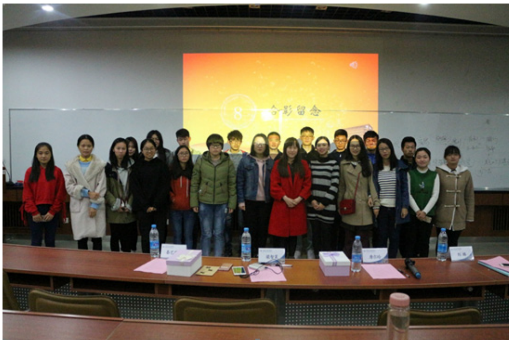
管理 1701 班与校友成长导师合影