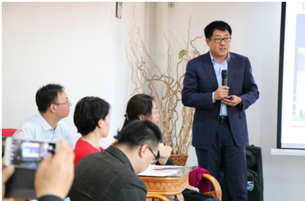
杨城校友做主题分享