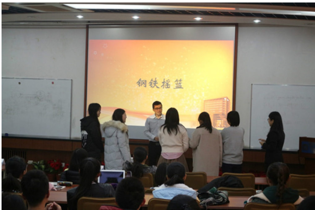
暖场环节——“你画我猜”

此次“新生成长导师”对话课系列活动注重导师与新生们之间的互动，让同学们都参与进来，从而为他们未来的大学规划和成长历程指明了方向。对话课开始时以暖场小游戏“你画我猜”拉近同学们和成长导师们之间的距离，让接下来的分享环节事半功倍。